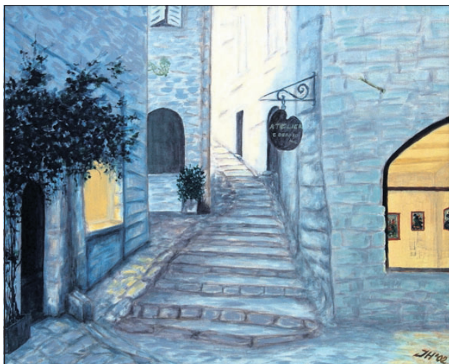
Motiv fra Sydfrankrig af Jolanta Hjorth.